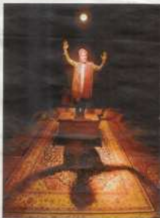
Subirà, a «Un conte de les mil i una nits»

Mig pallassos, mig nens Els protagonistes de l'espectacle, mig pallassos i mig nens, viuen amb la mateixa imaginació cap a l'imaginat fantàstic d'un món oriental, però amb unes transicions també perennement inesperades, fins als nostres dies.