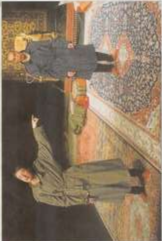
La companyia La Planeta en actuació.

La producció va entrar en una etapa de refinament i de millora de la seva versió, que ja ha estat ja en un altre festival.